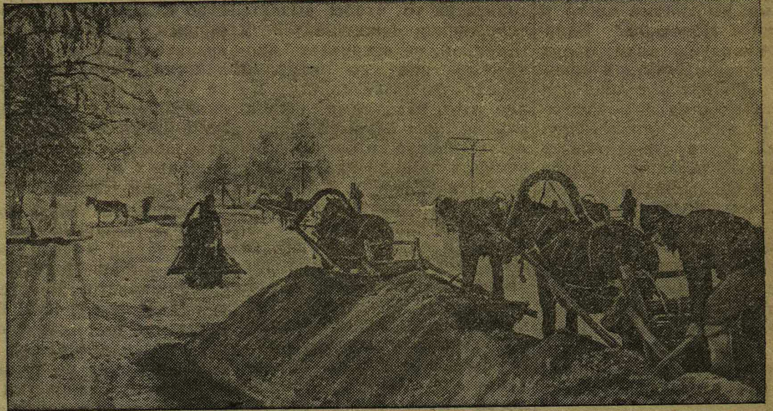
На снимке: Колхозники на строительстве дороги Ярославль—Рыбинск.

Для выполнения этой большой задачи трудящиеся Ярославского, Тутаевского, Рыбинского и других районов заключили между собой договор социалистического соревнования.